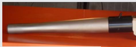
Реакционный упор Alco