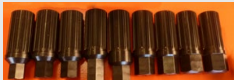
Прямые шестигранные хвостовики